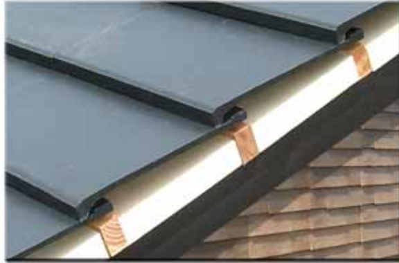
Air-roof insulation system